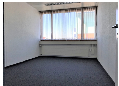
Raum 5, ca. 14 m 2