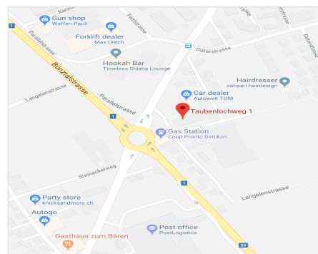
Taubenlochweg 1, 5606 Dintikon