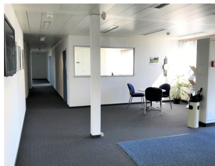
Empfang und Gang, mit Klimagerät